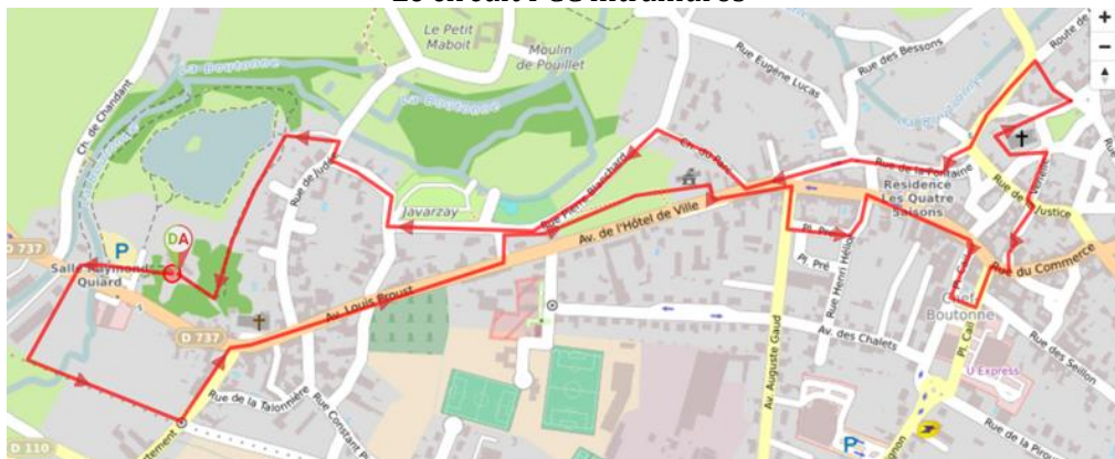
Le circuit PCC intramuros

Christian Aubert indique que suite au recensement du besoin, des devis de fournitures ont été sollicités. Il est précisé que la mise en place en sera assurée par les agents communaux.