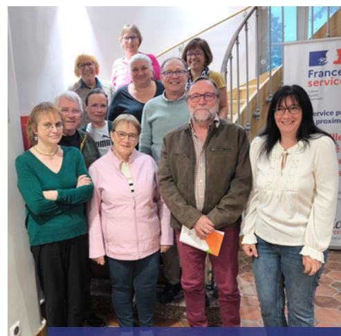
Le nouveau conseil d'administration