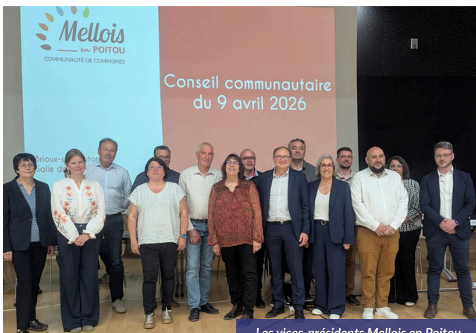
Les vices-présidents Mellois en Poitou

La communauté de communes gère de nombreuses compétences de la vie quotidienne (école, enfance-jeunesse, gestion des déchets, assainissement, développement économique...). De nombreux enjeux et défis seront à relever durant ce mandat.