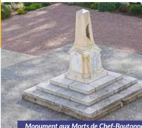
Monument aux Morts de Chef-Boutonne

Le 8 mai 1945 marque une date importante de la victoire des forces alliées sur l'Allemagne nazie et annonce la fin de la Seconde Guerre Mondiale en Europe.