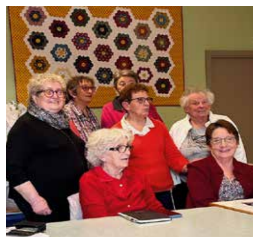
Quelques membres du Foyer Culturel

Dans un délai plus court, d'autres animations sont notamment au programme :