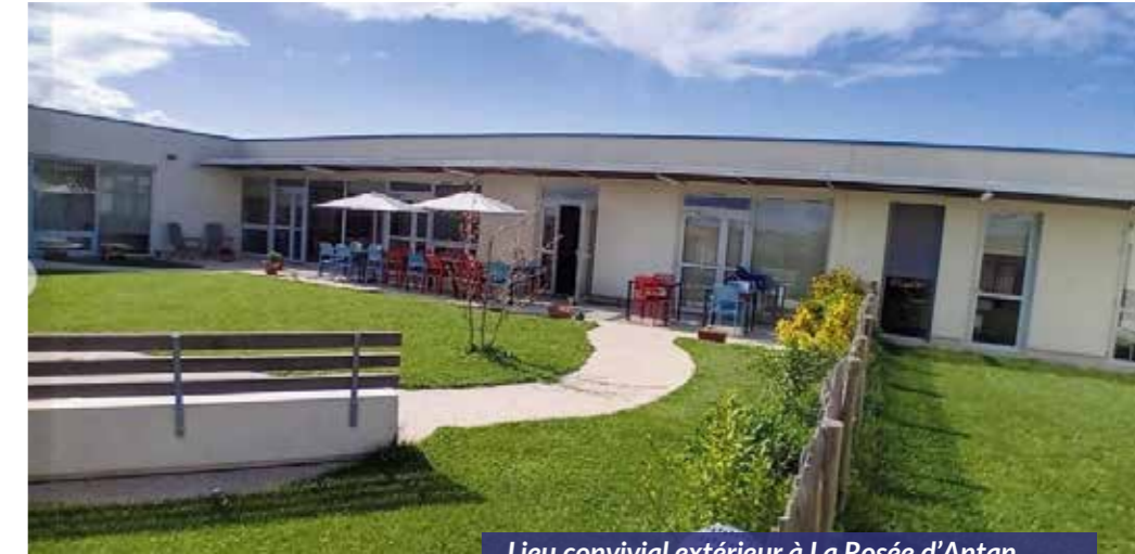
Lieu convivial extérieur à La Rosée d'Antan

C'est en Février 2023 que le nouvel Ehpad a ouvert ses portes. Il accueille actuellement 91 résidents. 65 agents en prennent soin.