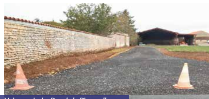
Voie provisoire Rue de la Pirounelle

En 2006, toutes ces compétences, hormis la voirie, ont été reprises par la communauté de communes de Cœur du Poitou. Le SVMC s'est de nouveau transformé en SIVU pour ne gérer que la voirie communale. A noter que la commune de Marcellé, regroupant Pouffonds et Saint-Génard, a rejoint le SIVU en 2017.