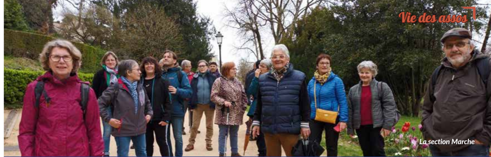
La section Marche