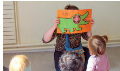
Animation : les bébés lecteurs

en octobre pour échanger autour des livres lus pour le vote du meilleur auteur. Plusieurs médiathèques du Poitou-Charentes participent à ce « Prix du Public » qui est communiqué ensuite à la ville de Cognac en novembre, avec tous les participants, lecteurs et en présence des auteurs.