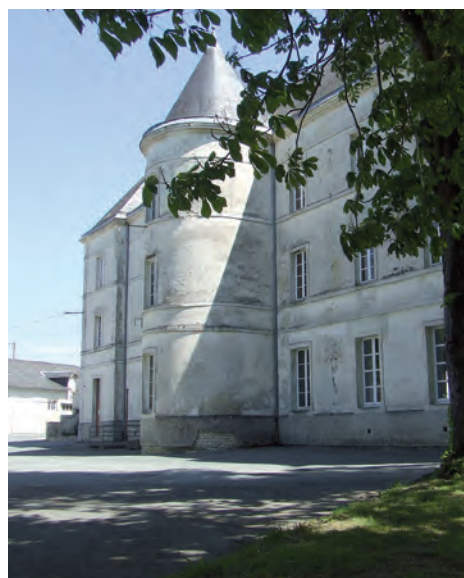
Façade arrière de la mairie