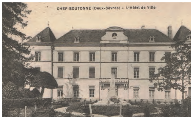
La mairie il y a plus d'un siècle

Les principaux changements dans ce projet consistent en l'agrandissement de la salle du Conseil Municipal au rez-de-chaussée, réellement nécessaire, une meilleure fonctionnalité des services et l'installation d'un ascenseur.