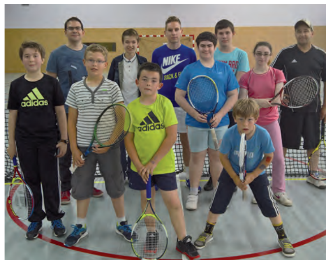
Quelques licenciés avec l'entraîneur et le président

Si vous êtes intéressés(es), retenez ces dates.