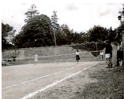
1 er court

Avant de voir les 2 courts au stade, savez-vous où se trouvait le 1 er court qui était alors en terre battue ? Il n'en reste aujourd'hui aucune trace mais il se trouvait Place Pré, en centre-ville, à l'emplacement d'une partie des Services Techniques, côté rue Henri Hélot.