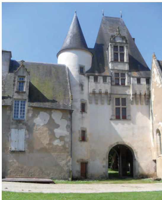
Château, côté étang

C'est pour cette raison que les élus travaillent depuis 2013 pour la rénovation de cet édifice classé. La mission des études a été confiée à Mme Niguès de Niort, architecte du patrimoine. De nombreux échanges avec la Direction Régionale des Affaires Culturelles (la DRAC) ont eu lieu pour déboucher (enfin !) sur une confirmation de l'aide de l'Etat pour la rénovation des façades, des couvertures et charpentes, de l'escalier qui mène à la tour ronde et de la mise en accessibilité (accès au rez-de-chaussée et création de toilettes pour personnes à mobilité réduite). Ces travaux se dérouleront en 4 tranches (de 2016 à 2019) en espérant que la première tranche concernant la tour « EST » puisse débuter avant l'hiver.