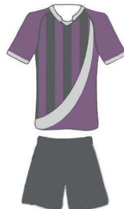
Les nouvelles couleurs du FC Boutonnais