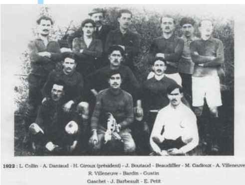
L'Espérance en 1922

qui resteront gravés dans les mémoires des chef-boutonnais et des 1400 joueurs qui ont signé un jour ou l'autre une licence chez les « verts ». N'oublions pas non plus les 17 présidents successifs qui ont impulsé avec de nombreux bénévoles leur envie pour le développement du club et leur passion pour le football.