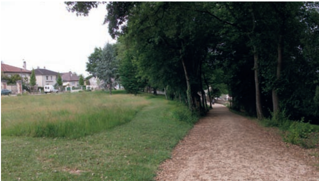
Parc de la Mairie

La réduction de l'emploi des pesticides est une volonté forte des élus de la commune de Chef-Boutonne, comme d'ailleurs dans les autres collectivités en général. Depuis 2008, nos agents utilisent des pesticides uniquement dans les cimetières. Cette décision, partagée entre élus et agents, a eu pour conséquence de métamorphoser la mission des agents. Une nouvelle organisation et de nouvelles pratiques sont donc nécessaires.