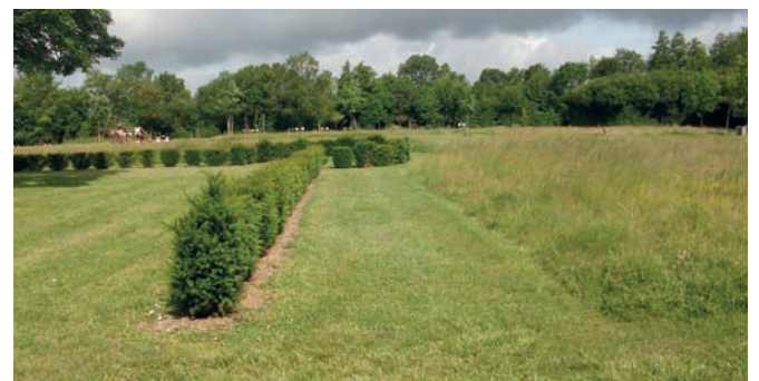
Parc du Château

Pour nous, une rue « propre » peut être une rue sans herbe mais c'est avant tout une rue sans pesticides.