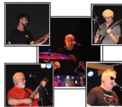
LES TONTONS FLINGUÉS

SURFIN'BOUTONNE (réservation au 05 49 29 62 31).