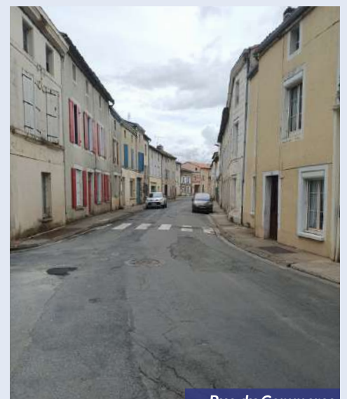
Rue du Commerce

Ces travaux de requalification urbaine donneront une image bien plus positive de ce carrefour et de l'entr e Est de Chef-Boutonne.