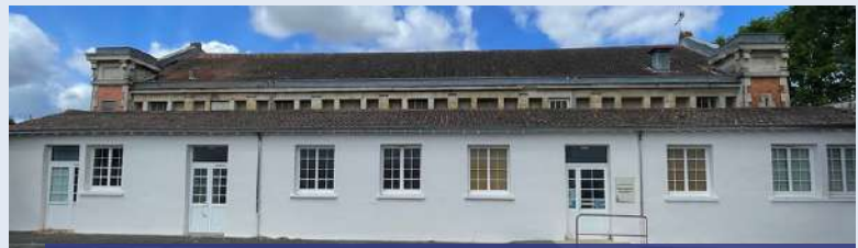
Prochainement, une fresque géante viendra orner la façade de la médiathèque

Le dessin final a fait l'objet d'une présentation aux élus, et a obtenu l'aval de l'architecte des bâtiments de France, il n'y aura plus qu'à mettre le premier coup de pinceau !