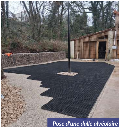
Pose d'une dalle alvéolaire par le SIVU

A Chef-Boutonne, les travaux programmés en 2026 porteront sur 4 300 m de voirie, 600 m de trottoirs, quatre puisards et 250 m de caniveaux ou de bordures.