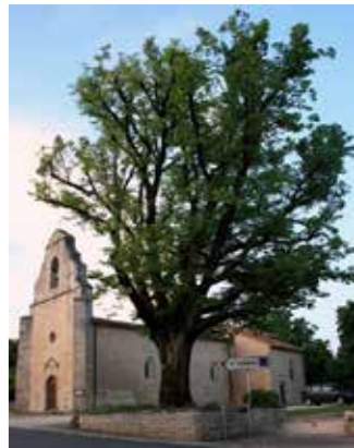
Eglise Saint-Sulpice de Tillou