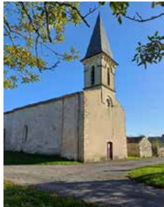
Eglise Saint-Gilles de La Bataille