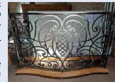
Œuvre réalisée par Max Quiard pour le concours du meilleur ouvrier de France

Seul ou avec ses collègues de l'association « Les Copains d'enclume » à Celles-sur-Belle, la retraite de ce Chef-Boutonnais est destinée à forger, avant tout pour le plaisir.