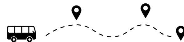
Les chauffeurs bénévoles du Mobilibus