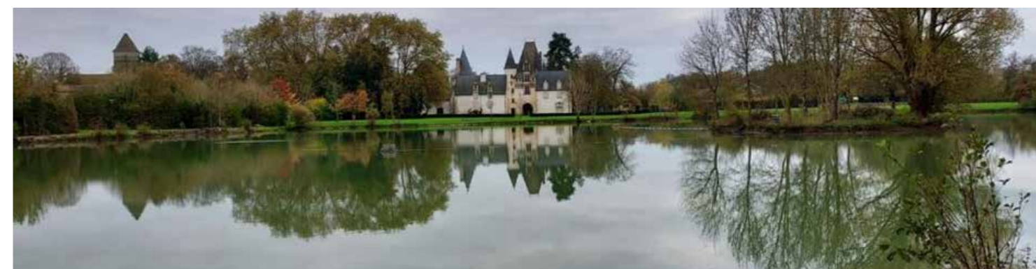
Etang de Javarzay

Jusqu'à maintenant, la pêche est gérée par la commune et l'association P.E.C.H était mandatée pour vérifier les cartes de pêche dans le cadre d'un accord. La commune n'est pas en capacité de les vérifier en permanence.