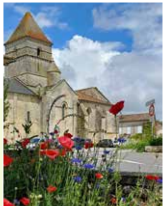
Eglise Saint-Chartier de Javarzay

S'il reste tout à concrétiser dans ces projets importants, les élus ont pris d'ores et déjà les premières décisions pour la sauvegarde de nos églises. Ces édifices font partie de notre patrimoine, qui dépassent le simple aspect religieux.