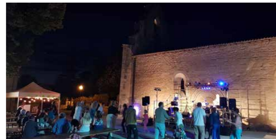
Soirée du 13 juillet 2024

7 bénévoles composent le bureau et proposent des événements culturels locaux depuis 5 ans : Journées des peintres, concerts de musique lyrique dans l'église Saint-Sulpice, animations et visites lors des journées du patrimoine, concert chorale, troc livres, édition et vente du calendrier du village, fêtes franco-britanniques ; autant d'actions qui visent à mettre en valeur le patrimoine tillolais.