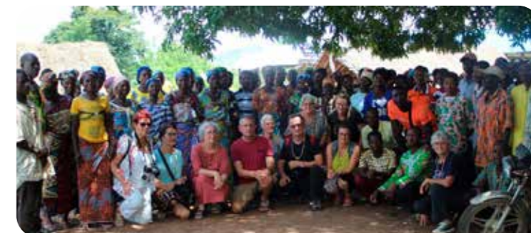
La délégation Chef-Boutonnaise entourée des habitants du village d'Agavé.

La mission avait un double objectif : faire découvrir aux bénévoles le canton de Kamé, où se situe la commune d'Agavé et observer l'avancement des projets menés par l'association. Mais aussi, pour le comité de jumelage : organiser à distance une première rencontre entre élus, afin de renforcer le lien institutionnel du jumelage.