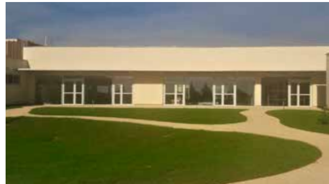
Baptisé "La Rosée d'Antan", le nouvel établissement pour personnes âgées et dépendantes ouvrira en février.

Après 24 mois de travaux, le nouvel EHPAD "La Rosée d'Antan" est prêt à ouvrir ses portes. Mi-février, personnel et résidents de l'EHPAD "Les Quatre Saisons" déménageront dans ces locaux flambants neufs, situés Rue de la Pirounelle. Avec une capacité de 94 places, dont une zone "sécurisée" Alzheimer (14 lits), la structure offrira un grand hall d'accueil style "Place de village", des cuisines et espaces de travail améliorés pour le personnel, des chambres individuelles, ainsi que des salons pour recevoir la famille. À l'extérieur, de grands espaces de repos et de promenade s'ouvrent sur un cheminement piéton public. Coût de l'opération : 11 500 000 € TTC.