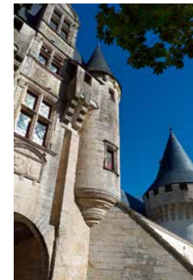
"Magnifique rénovation", saluent nos nombreux visiteurs.

3355 visiteurs ont été accueillis cette année, soit le double de l'année 2020 avant la fermeture. 473 provenaient du secteur de Chef-Boutonne, signe d'une réappropriation du château par ses habitants, qui pour certains sont revenus plusieurs fois. Concernant les autres visiteurs, 55% venaient de la région Poitou-Charentes. À noter, côté étrangers : le retour en force des britanniques que le Brexit n'a semble-t-il pas découragés. Les pics de fréquentation ont été en juillet et août, malgré la canicule, lors des Journées du Patrimoine et des animations/expositions proposées sur le site.