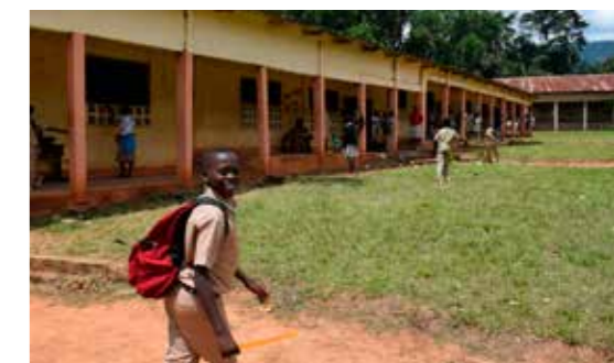
Depuis 30 ans, les parrainages facilitent la scolarité des collégiens d'Agavé.

D'autres besoins ont été identifiés par les habitants, notamment en petit matériel agricole (égreneuse à maïs, motoculteur, décortiqueuse à riz). ARBRES organisera prochainement une collecte de ferrailles pour lever les fonds nécessaires à cet outillage.