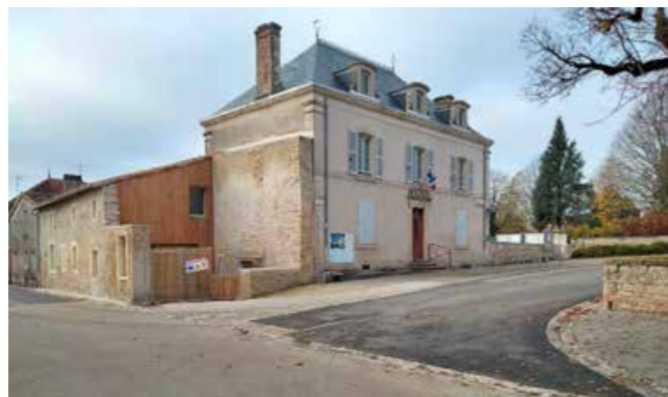
Le carrefour devant la Mairie de Tillou est désormais sécurisé.

Enfin, nous avons effectué la réfection totale de la couverture en ardoises de la Mairie.