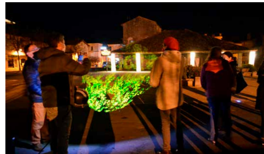
Essais des projecteurs "gobos" Place Cail, en présence des élus (novembre 2020).

Les monuments choisis pour cette mise en lumière sont situés le plus souvent au cœur de cité, proches des commerces (place historique, halles par exemple). L'initiative du Département, validée par les communes de La Mothe-Saint-Héray, Celles-sur-Belle, Melle et Chef-Boutonne pour le Mellois, ainsi que Coulon, Oiron, Saint-Loup-Lamairé, s'est donc concrétisée. Pour développer ce projet, un Comité de Pilotage, où chaque commune était représentée, s'est appuyé sur les études du Cabinet Concepto , assistant à maîtrise d'ouvrage et sur Quartiers Lumières , entreprise spécialiste de la