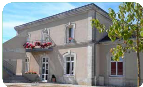
Depuis 1996, l'ancienne gare de Chef-Boutonne est une Résidence Habitat Jeunes. 8 logements actuellement.

S. Piat : Toits Etc est une association loi 1901, née à Chef-Boutonne en 1996, membre du mouvement "Habitat Jeunes". Installée dans les locaux vacants de l'ancienne gare, elle aménage la première Résidence Habitat Jeunes (RHJ) du territoire. En 2019, elle déménage son siège à Melle, mais les 8 appartements de la gare (5 chambres + 2 T1 + 1 T3) gardent leur vocation : ils sont destinés à des jeunes en début de parcours professionnel qui n'arrivent pas à trouver une solution adaptée de logement.