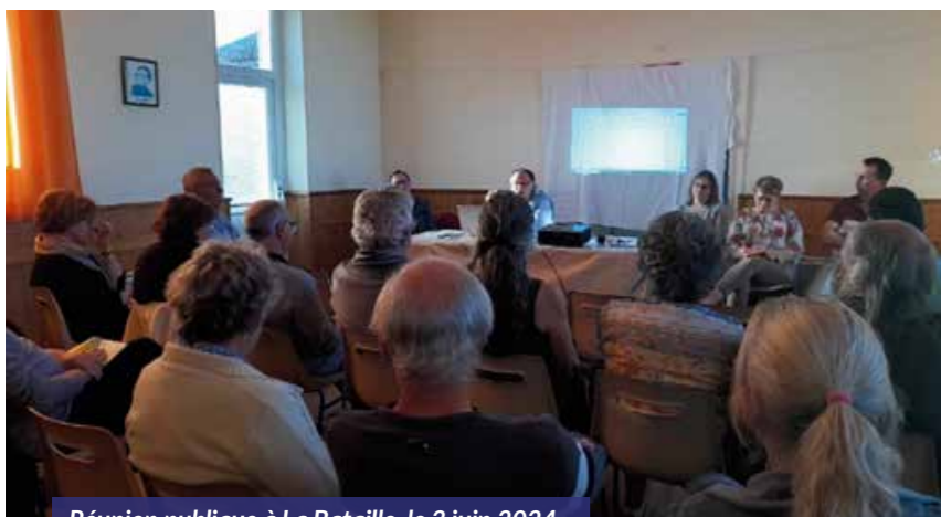
Réunion publique à La Bataille, le 3 juin 2024

Au cours du mois de juin, se sont tenues à Chef-Boutonne et dans les mairies déléguées (Tillou, Crézières et la Bataille), des réunions publiques .