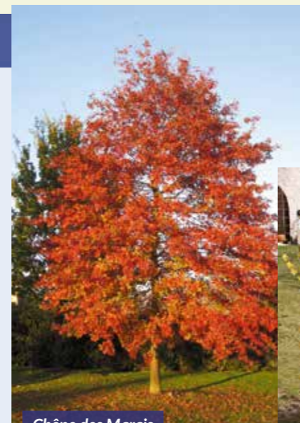
Chêne des Marais

Quelques espèces d'arbres prévues à la plantation