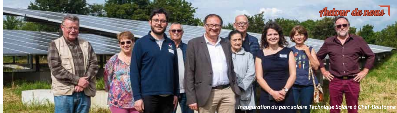
Inauguration du parc solaire Technique Solaire à Chef-Boutonne