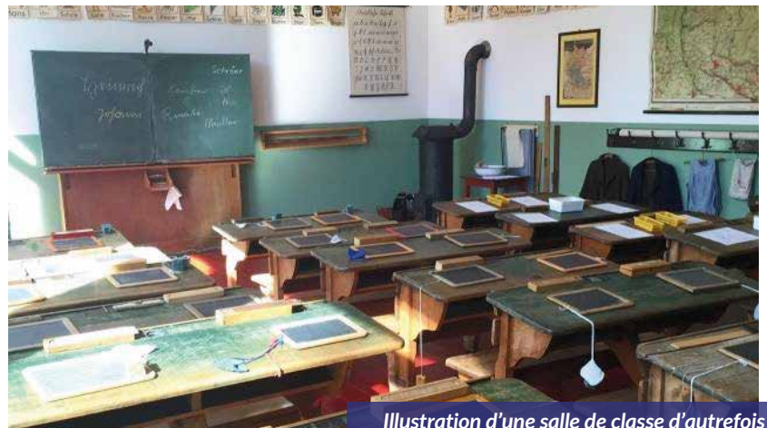
Illustration d'une salle de classe d'autrefois

Une exposition se tiendra au Château de Javarzay du 22 septembre au 27 octobre 2024. Elle s'intitule « les Ecoles du Canton de Chef-Boutonne ».