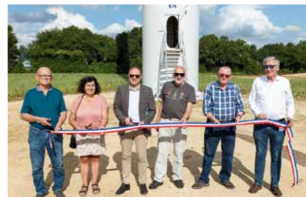
Inauguration du parc éolien des Châteliers avec Energie Team

Peut-être ne le saviez-vous pas, mais notre commune de Chef-Boutonne est excédentaire en électricité, entre la production et la consommation locale. En effet, nous disposons actuellement de deux sources principales d'énergie renouvelable, le parc photovoltaïque situé route d'Aubigné et le parc éolien des Châteliers à Tillou.