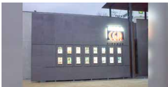
Cinéma CGR NIORT, panneaux d'affichage