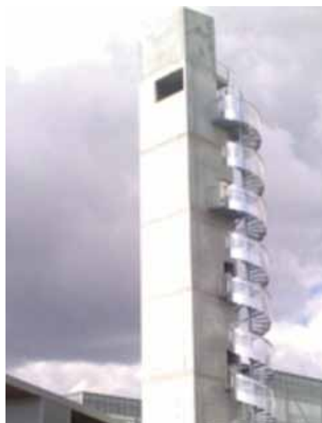
Centre de secours NIORT, Escalier Hélicoïdal

Si vous désirez en savoir plus et voir les photos des différents travaux réalisés, vous pouvez consulter le site internet : www.serrurerie-metallerie-marchet.fr Tél. : 05 49 29 80 12