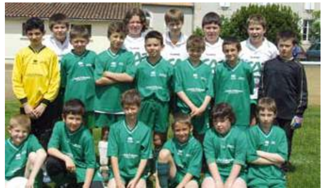
Équipes poussins et benjamins lors d'un tournoi (saison 2007-2008)

Tous ces passionnés ont eu à cœur, dans des périodes différentes et avec des moyens différents, de développer ce sport populaire. Aujourd'hui, ce club, bien structuré, peut faire face aux défis sur le terrain !